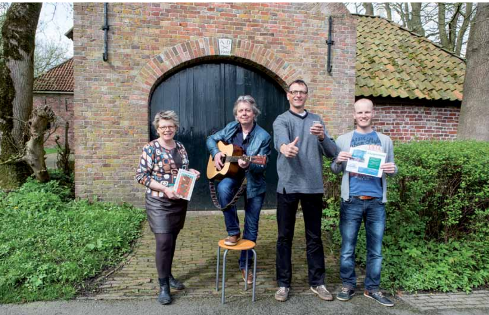
Welke directeur doet wat om ouderbetrokkenheid te stimuleren?